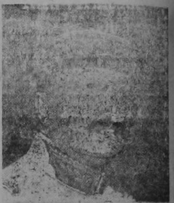
Francia.—El general Degoutte, que se hace cargo del comando de las tropas del Marruecos francés.